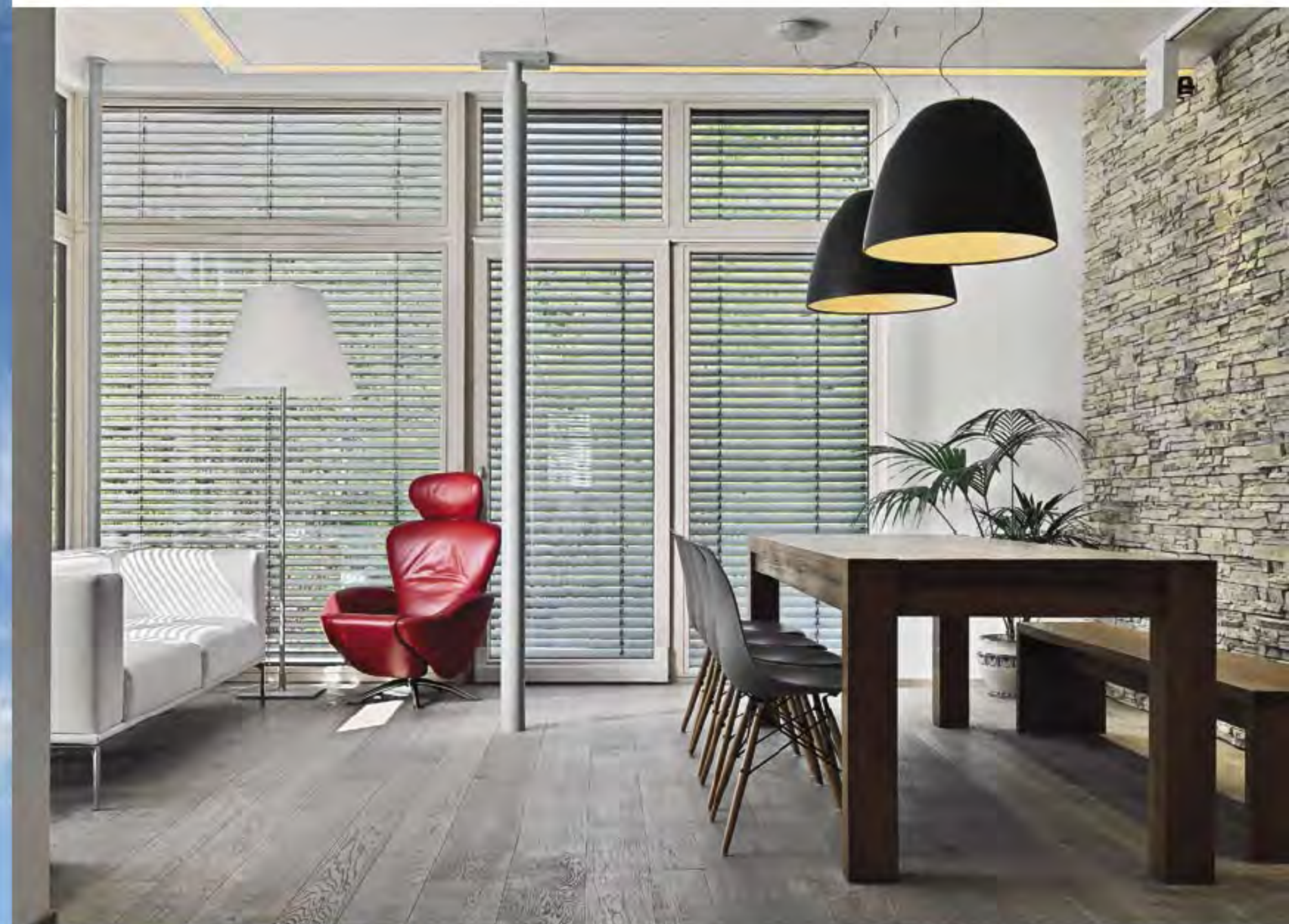
В создании интерьера использовались культовые предметы дизайна – подвесные светильники Nur фирмы Artemide и стулья DSW фабрики Vitra.